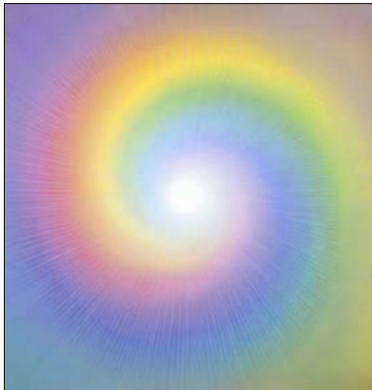
© Barry Stevens, Oneness - www.mandalas.co.uk

"Dere gjør ikke en eneste bevegelse uten meg. Det er ikke en eneste tanke som ikke har sin utspring i min energi. Det er ikke en eneste gjerning hvor jeg ikke er med i bildet. Selv der hvor dere er sikre på at Gud ikke er, ER JEG."