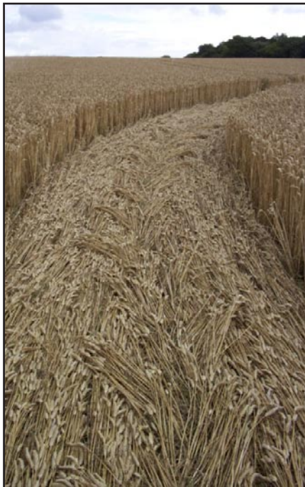
Et annet detaljbilde fra formasjonen ved Scrope Wood. Legg merke til flettingen i midten.

Min første sansning var at den sa noe om at den som skulle ekspandere måtte vokse i to retninger på en gang. Dette er enkelt å forstå gjennom å tenke på planter, som må utvikle røtter, samtidig med at de får blader og frukter. De må som oss vokse nedover, for å vokse oppover. Men dette prinsippet vil også gjelde i for eksempel tid. Vi må vokse i fortiden, for å vokse i fremtiden. Dette er en av årsakene til at stadig flere henter opp minner fra tidligere liv. En annen måte å se det på er at jo fullere vil bli, jo mer må vi kunne være tomme. For en lineær bevissthet vil det å være full stå i motsetning til det å være tom. For en ekspanderende bevissthet er det tvert i mot nødvendig, på samme måte som treet må ha store røtter for å kunne bære en flott krone, må mennesket være tomt for å kunne bære fullheten. Den fjerde dimensjon er manifestasjonen av tid og rom. Den femte dimensjon er for eksempel menneskets bevissthet som beveger seg gjennom tid og rom. Alle de tynne sirkelstiene i denne kornsirkelen, symboliserer mennesket som utforsker den fjerde dimensjon,