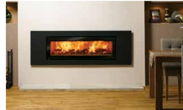
Riva Studio 3 med Steel ramme

Se mer informasjon om dekorrammer på side 15