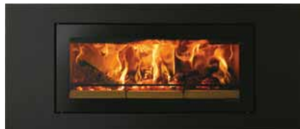
Riva Studio med rammen Steel