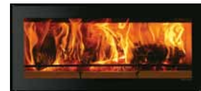
Riva Studio uten ramme

En Riva Studio peisinnsetser kan også leveres med flere ulike dekorrammer. Utvalget spenner seg fra den enkle Profilrammen til de store rammene i sort glass eller stål. Valgmulighetene er mange. Riva Studio kan også monteres uten ramme for et minimalistisk utseende, se baksiden.