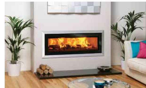
Riva Studio 3 med Bauhaus ramme, polert stål