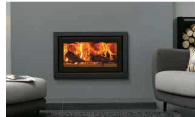
Riva Studio 1 med Profil ramme, midnight black