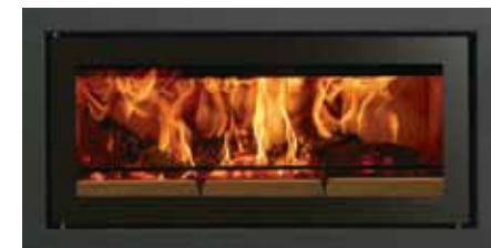
Riva Studio med rammen Profil (med plan front)