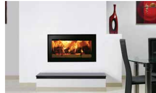
Riva Studio 1 uten ramme