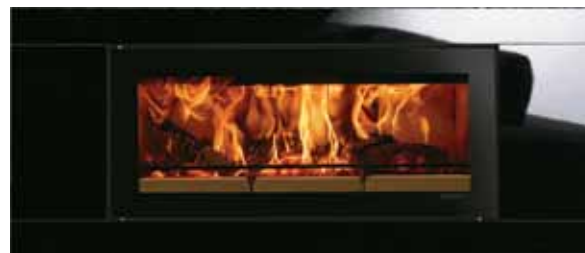
Riva Studio med glassramme