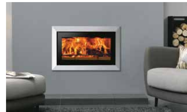
Riva Studio 1 med Bauhaus ramme, polert stål