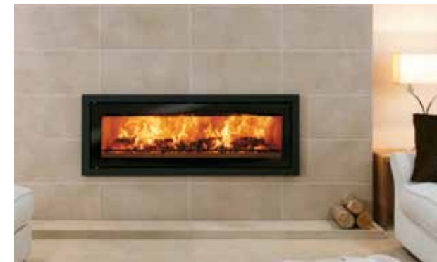
Riva Studio 3 med Profil ramme, midnight black