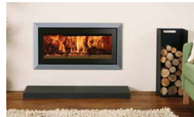
Riva Studio 2 med Bauhaus ramme, polert stål