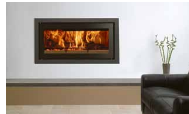
Riva Studio 2 med Profil ramme, midnight black