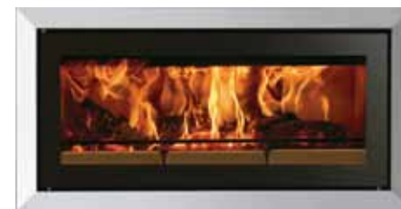
Riva Studio med rammen Bauhaus polert stål (skråstilt)