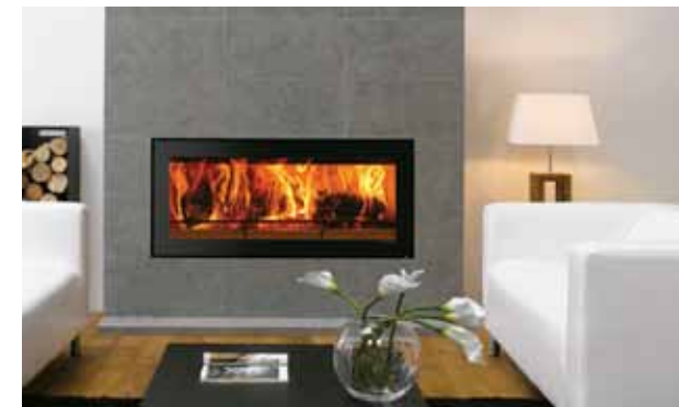
Riva Studio 2 uten ramme

Se mer informasjon om dekorrammer på side 15