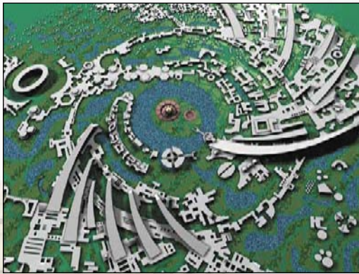
The Galaxy Auroville slik det er planlagt om endel år.

Auroville er et totalt ikke-hierarkisk samfunn. Frivillige som vil vie seg til å møte de administrative behovene til samfunnet blir valgt årlig. De fleste store beslutninger blir tatt ved avgjørelser på generelle møter hvor alle fra Auroville