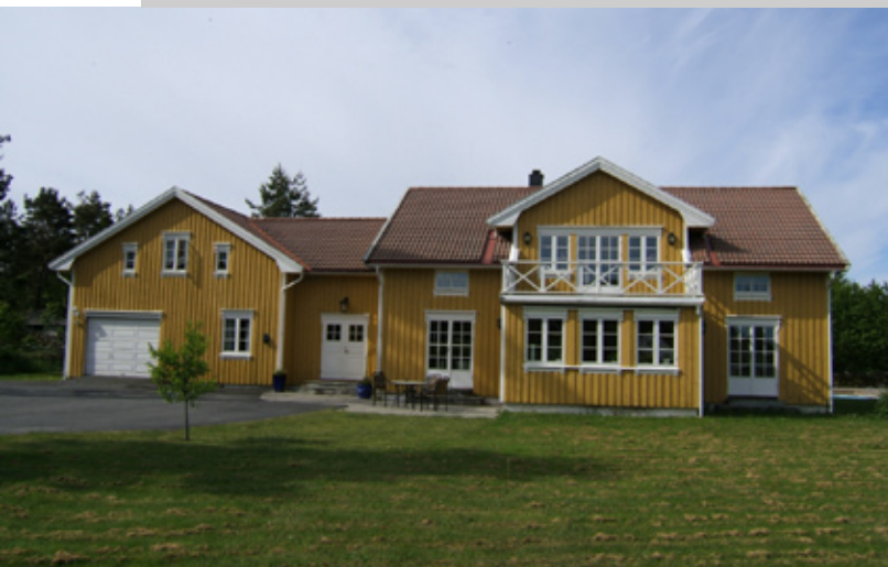
Huset ved Spornes på Tromøy utenfor Arendal. Ildsjelen har kontor ved vinduet til høyre for garasjen.

I begynnelsen av mai kom jeg så over et nettsted jeg hadde blitt tipset om før. Det var om en film som het The Secret . Etter som jeg leste om den ble jeg gradvis mer interessert. Det viste seg at filmen ganske nylig var blitt ferdig og som den første spillefilm i verden hadde den nylig hatt premiere over Internet. Så samme kveld så jeg filmen via bredbånd for ca. 40,- kroner. Jeg ble ganske umiddelbart begeistret for filmen og bestilte DVDutgaven. Den handlet jo nettopp om det som jeg fokuserte på nå, at man tiltrekker ved tankens kraft det man fokuserer på, kort sagt; loven om tiltrekning. Denne filmen kom akkurat til riktig tid. Det er også en forskjell å lese en bok i forhold til å se en film om samme tema, begge metodene kan utfylle hverandre og gi aha-opplevelser på hver sin måte.