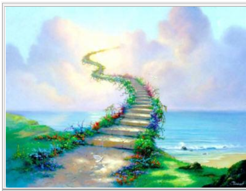
© Jim Warren "Stairway to Heaven"

Vi leste åpent tanker m/følelser som energipakker med et visst innhold.