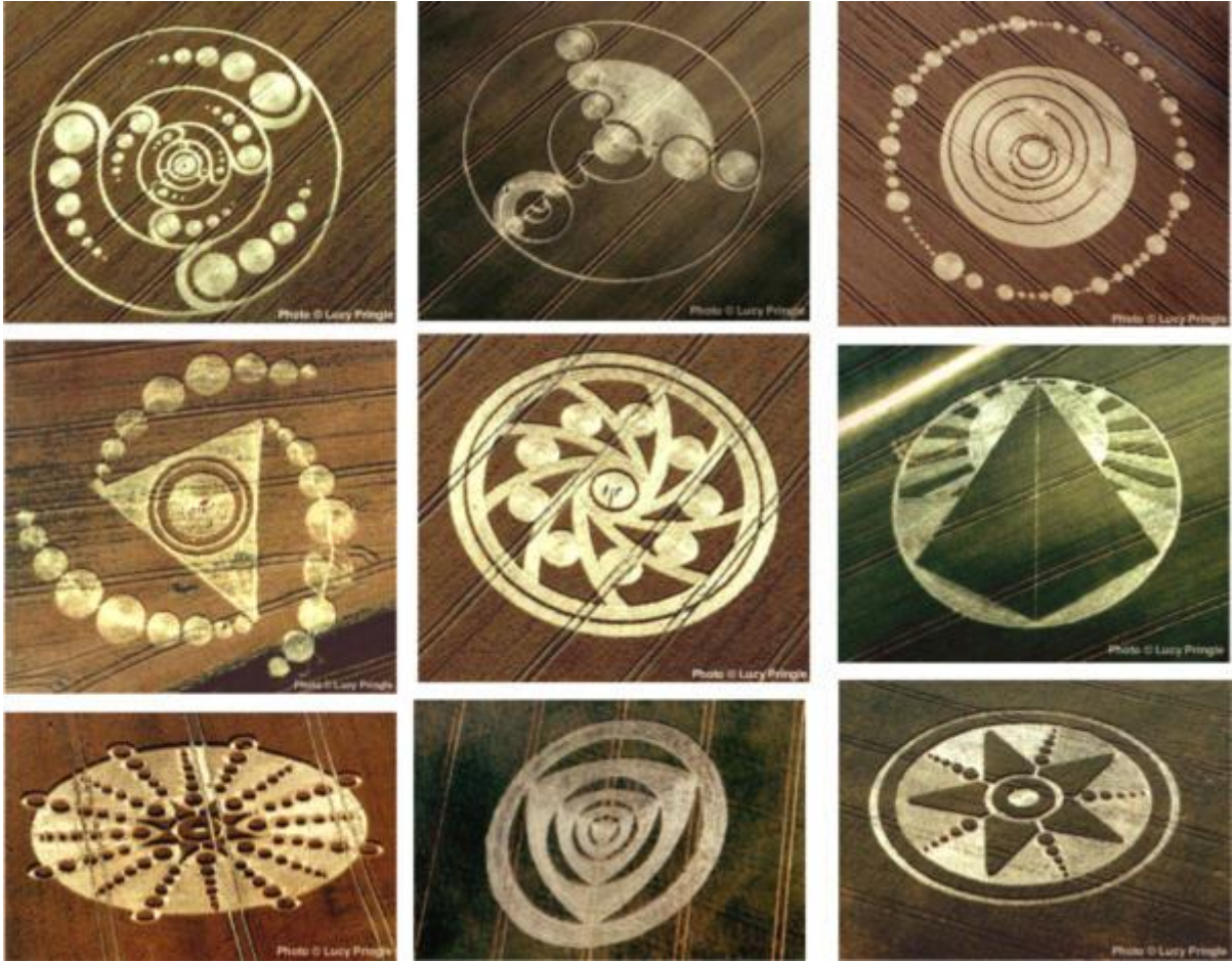
Bildene ovenfor er fotografert i år 2001 mens bildene nedenfor ble tatt i år 2000. Bildene viser bare et lite utvalg av kornsirkelene som har oppstått i disse to årene.