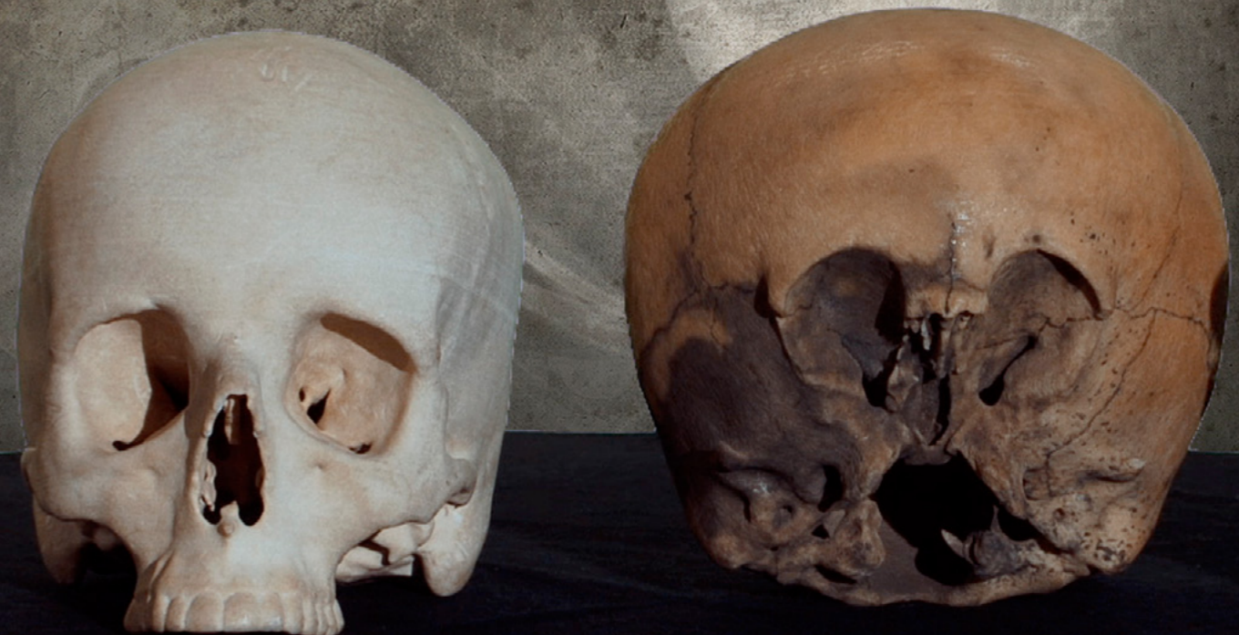
Mennesket og The Starchild Skull

En sekvens med forskeren Lloyd Pye og ”Starchild” hodeskallen inngår forøvrig i den nye norske UFO-filmen ”Dagen før avsløringen” (The Day Before Disclosure). Se www.newparadigm.no